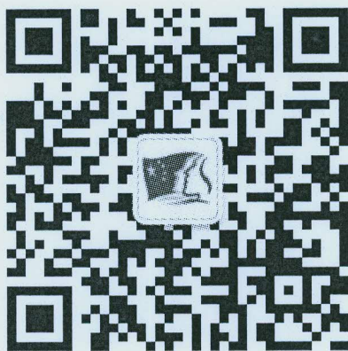
(共青团中央微信公众号)